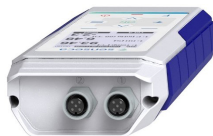
PRO D05.2 - 2 ingressi connettore M12