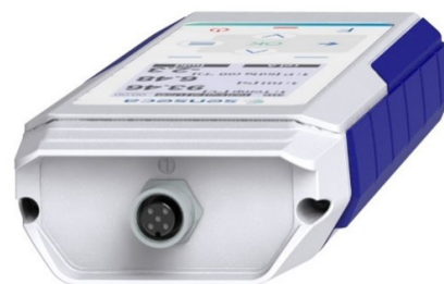
PRO D01 - 1 ingresso connettore M12