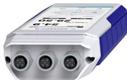
PRO D05.3 - 3 ingressi connettore M12